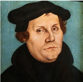
Мартін Лютер (1483-1546) — католицький священик, ініціатор руху в Церкві, пізніше названого Реформацією

Реформацію пов'язують з іменами Мартіна Лютера, Жана Кальвіна та Ульріха Цвінглі, її ще називають протестантською, лютеранською або євангелічною.