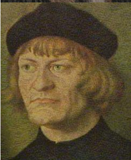
Ульріх Цвінглі (1484-1531) — діяч Реформації у Швейцарії, теолог, протестантський пастор

Передумовою до Реформації була криза папства у XIV-XV ст. Рух із церковного поступово переростав у суспільний через невтілені надії на церковну реформу після рішень Константського собору 1414-1418 років (папа Мартін V) і особливо — Базельсько-Флорентійського собору 1431-1449 років (папа Євгеній IV), а також віденського конкордату 1448 року щодо Німеччини між римсько-німецьким кайзером Фрідріхом III і папою Миколаєм V.