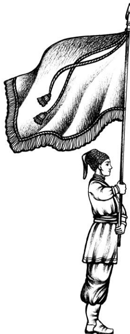
Мал.3. Постава Козацької Хоругви для руху урочистим ходом