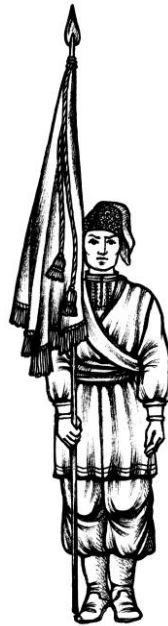
Мал.1. Постава Козацької Хоругви в ладy на місці

Під час проходження урочистим ходом Козацьку Хоругву несуть, як показано на мал. 3.