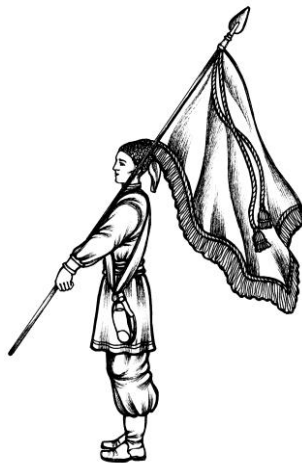
Мал.2. Положення Козацької Хоругви на плечі