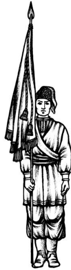
Мал.1. Постава Козацької Хоругви в ладу на місці

Під час проходження урочистим ходом Козацьку Хоругву несуть, як показано на мал. 3.