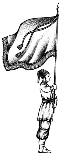
Мал.3. Постава Козацької Хоругви для руху урочистим ходом