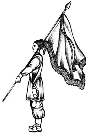
Мал.2. Положення Козацької Хоругви на плечі