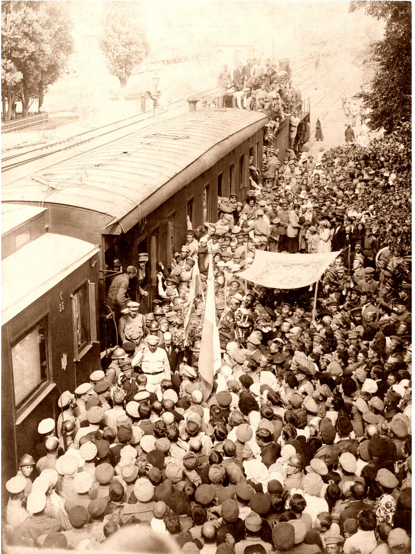
Зустріч Симона Петлюри на залізничному вокзалі у Фастові після звільнення міста від більшовиків. 29 серпня 1919 року