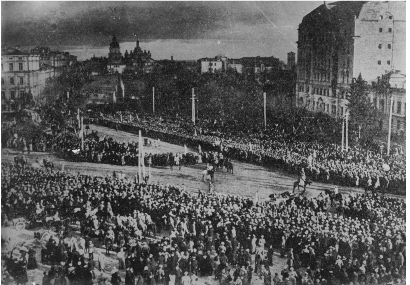
Проголошення Акта Злуки українських земель на Софійській площі в Києві. 22 січня 1919 року