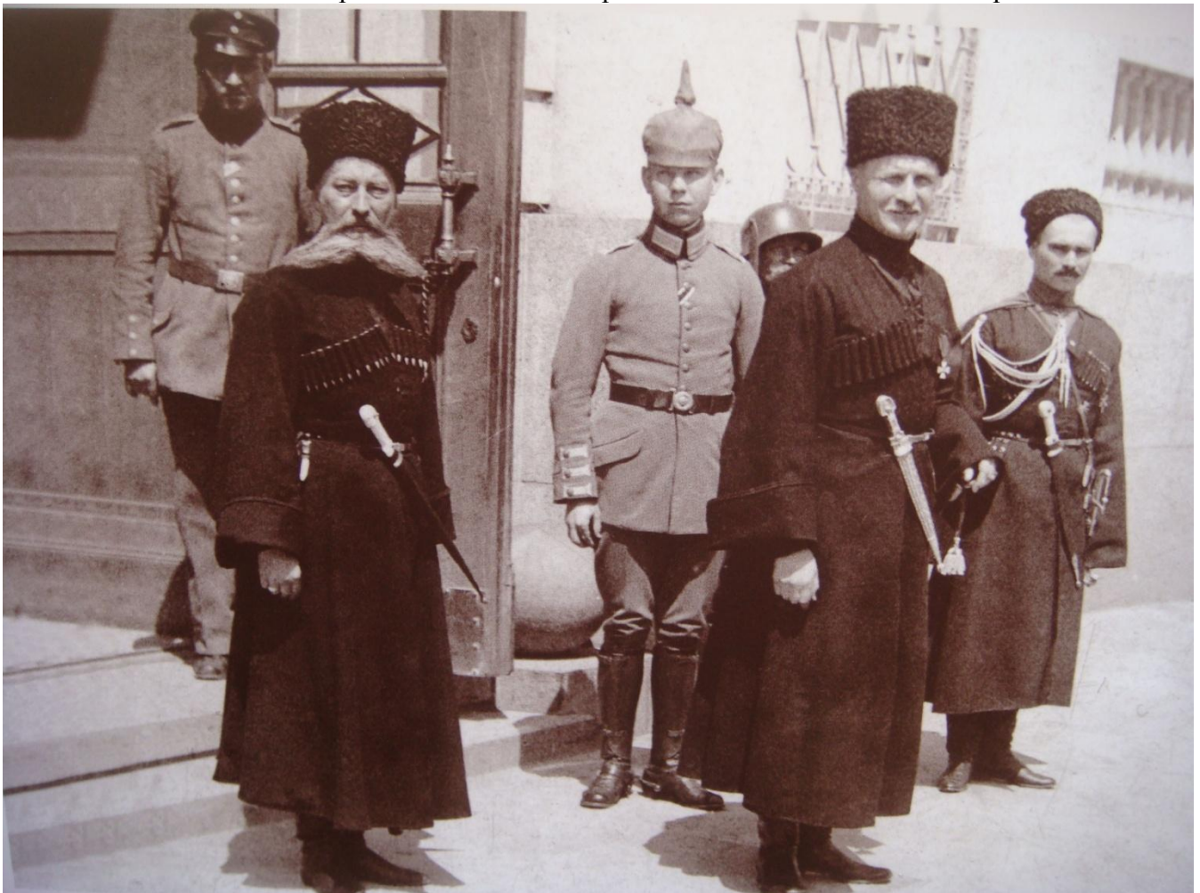
Гетьман Павло Скоропадський з Миколою Сахно-Устимовичем (ліворуч) – командувачем власного конвою. Київ, вул. Катерининська (нині – Липська). 1918 рік