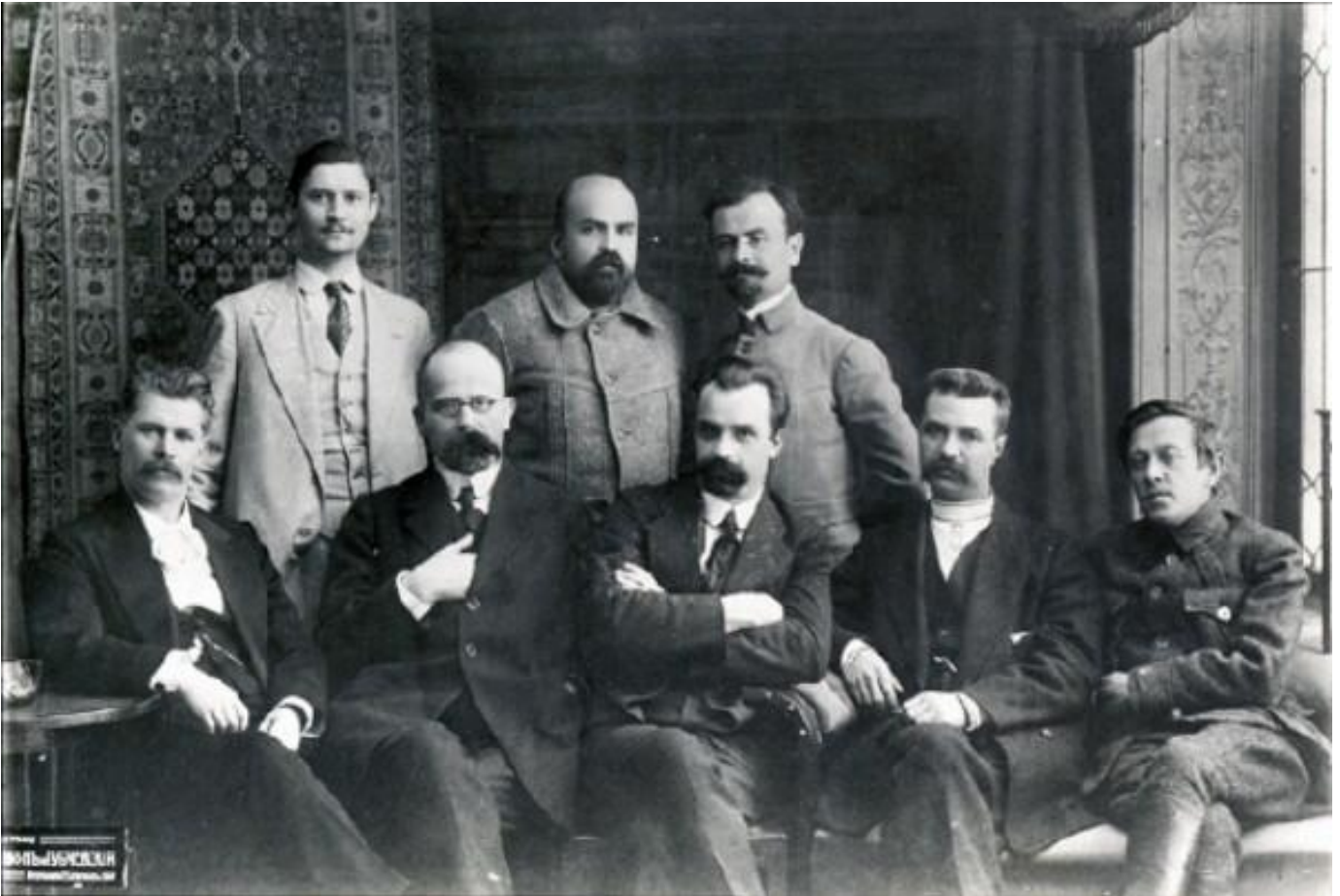
Члени Генерального Секретаріату – першого уряду України. Сидять справа наліво: Симон Петлюра, Сергій Єфремов, Володимир Винниченко, Іван Стешенко, Микола Садовський. Стоять: Борис Мартос, Микола Стасюк, Павло Христюк. 1917 рік