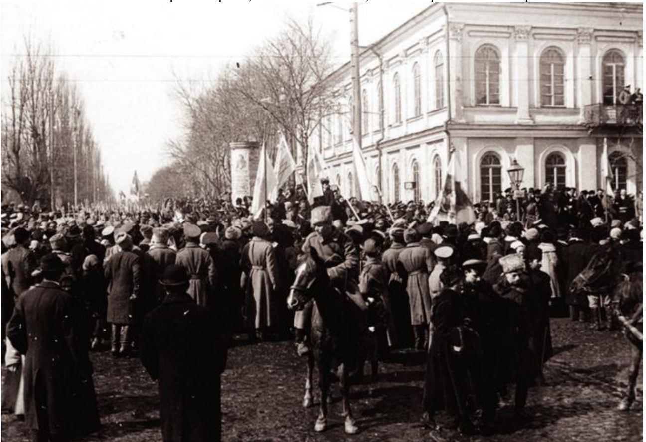
Маніфестація в Києві з нагоди проголошення Української Народної Республіки. 20 листопада 1917 року