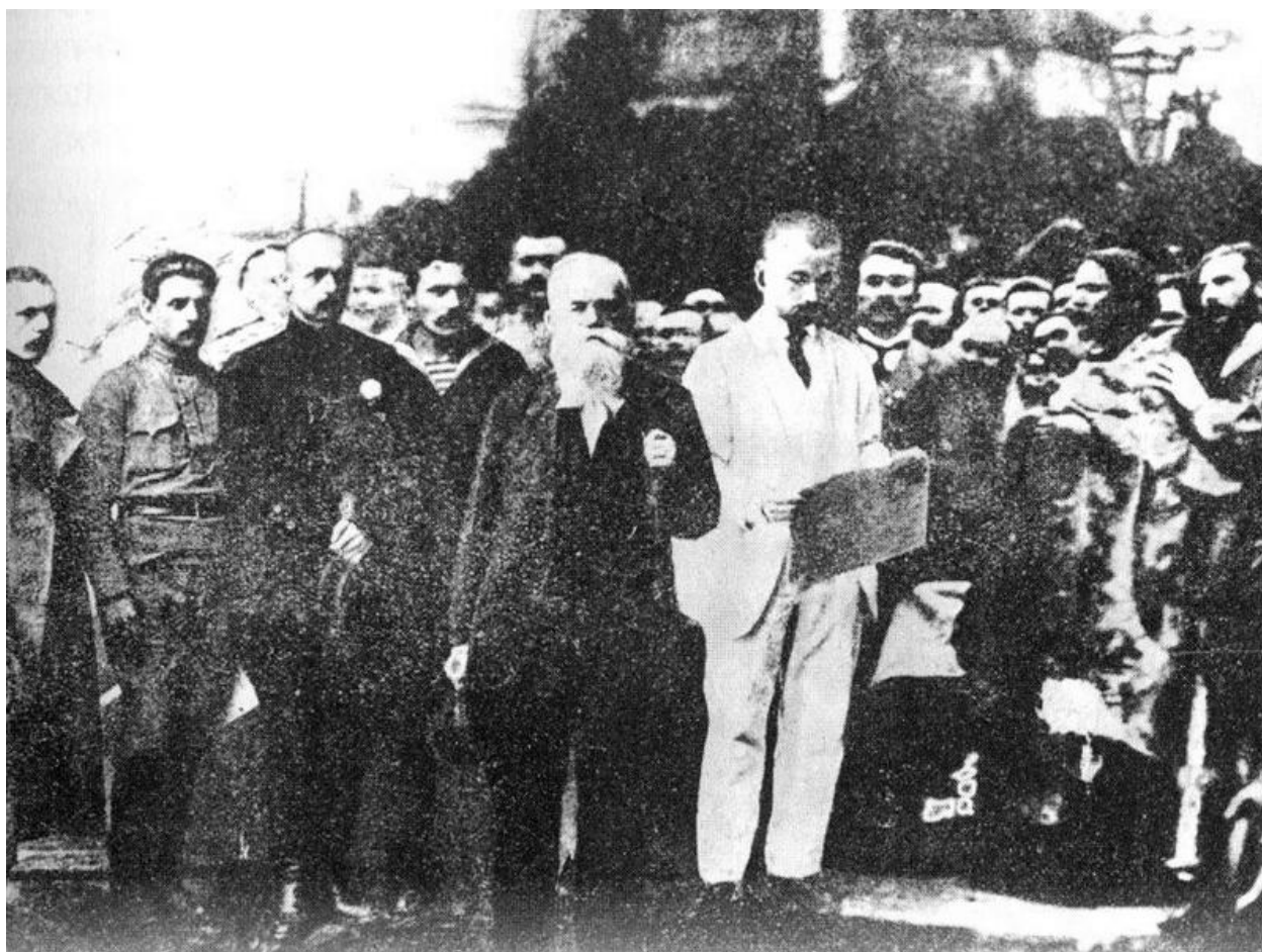
Проголошення I Універсалу Української Центральної Ради на Софійській площі. У центрі – Михайло Грушевський. Червень 1917 року