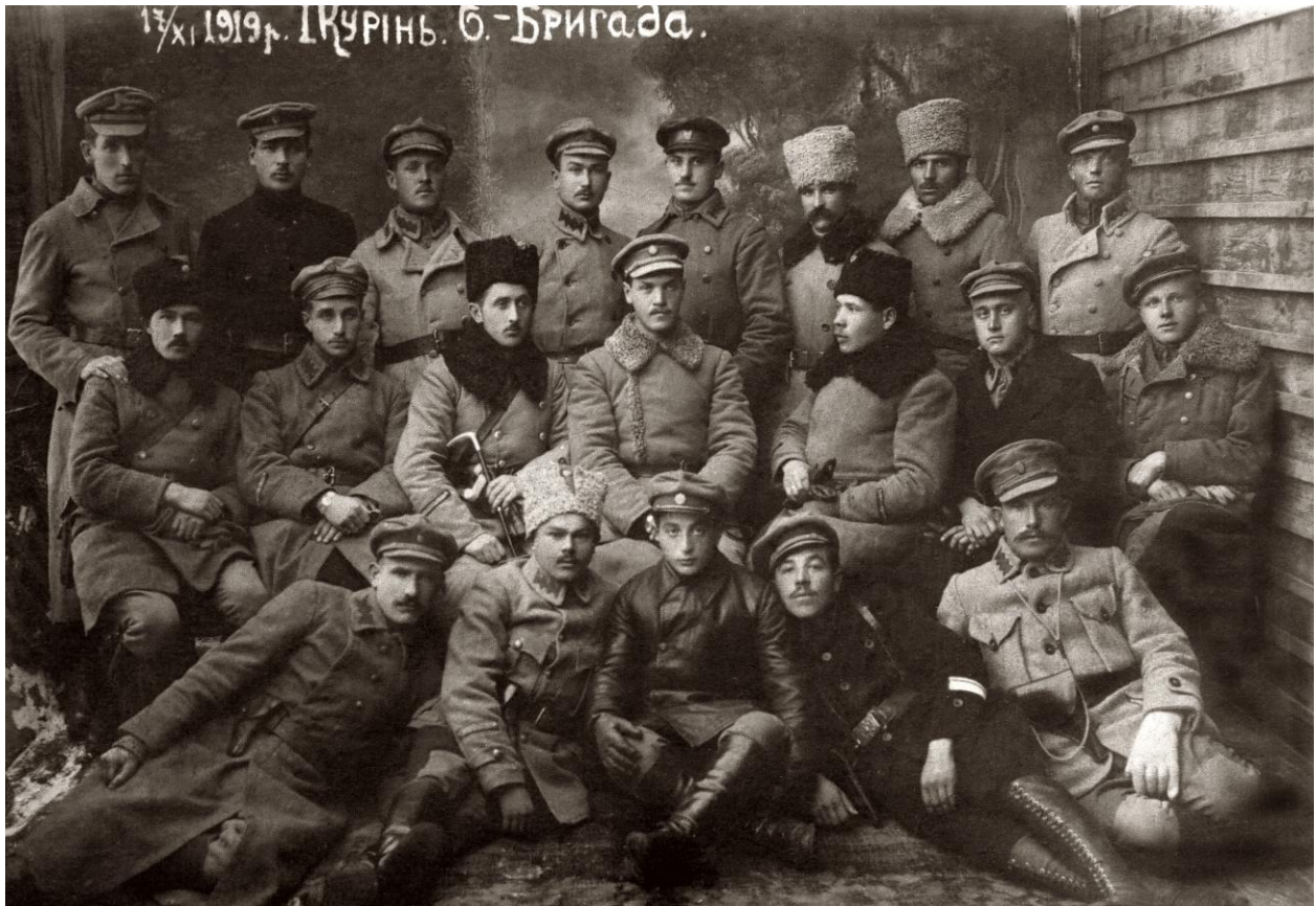
Перший курінь шостої бригади Української Галицької Армії. 17 листопада 1919 року