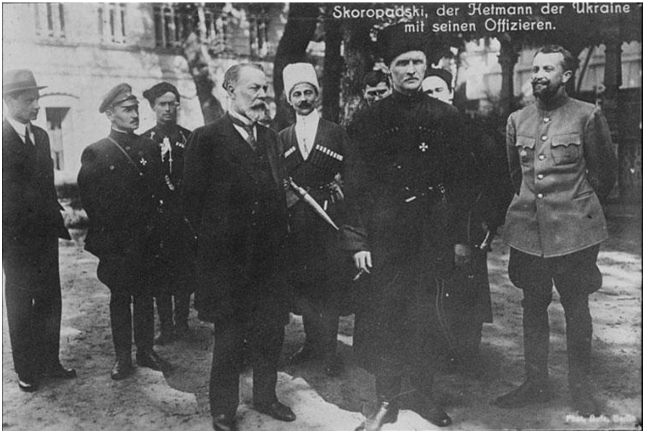
Гетьман Павло Скоропадський з прем'єр-міністром Федором Лизогубом та офіцерами. У центрі ад'ютант Олександр Сахно-Устимович. Київ. 1918 рік