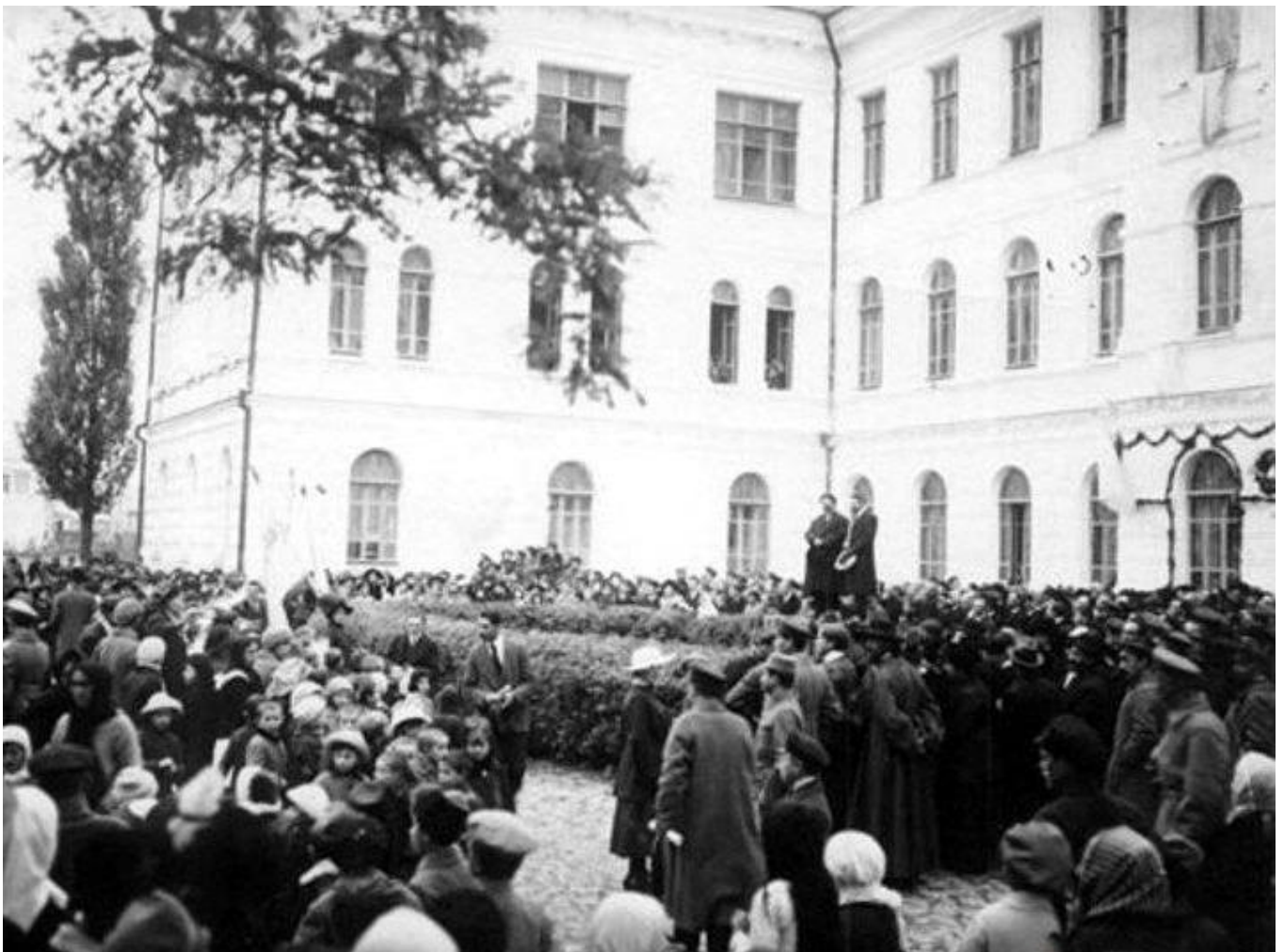
Урочисте відкриття Кам'янець-Подільського університету за участю Івана Огієнка – першого ректора. 1918 рік