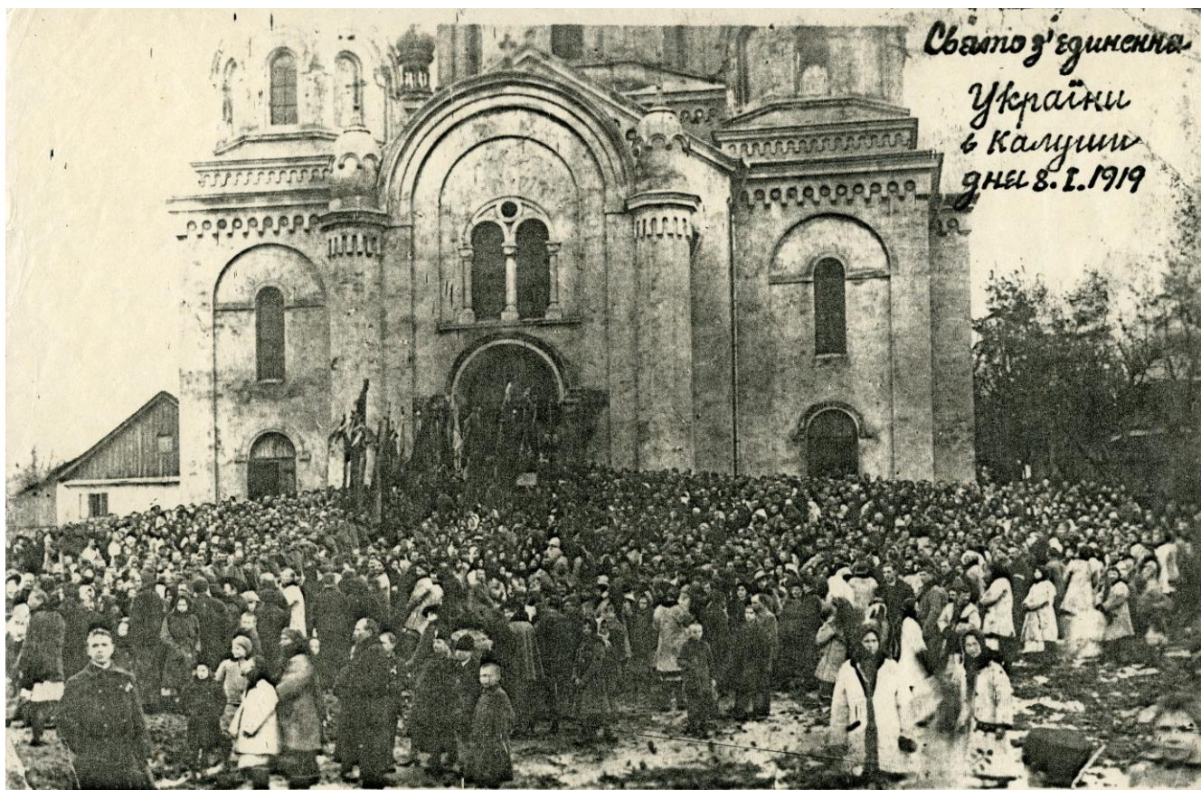
Святкування об'єднання з Великою Україною в місті Калуші. Січень 1919 року