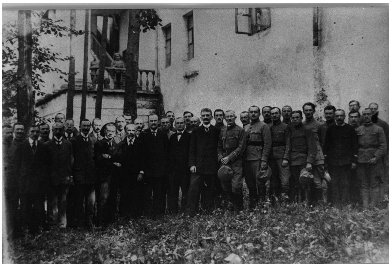
Уряд ЗУНР. У центрі – Президент ЗУНР Євген Петрушевич, державний секретар закордонних справ Степан Витвицький, голова Державного Секретаріату Сидір Голубович. Кам'янець-Подільський. Осінь 1919 року