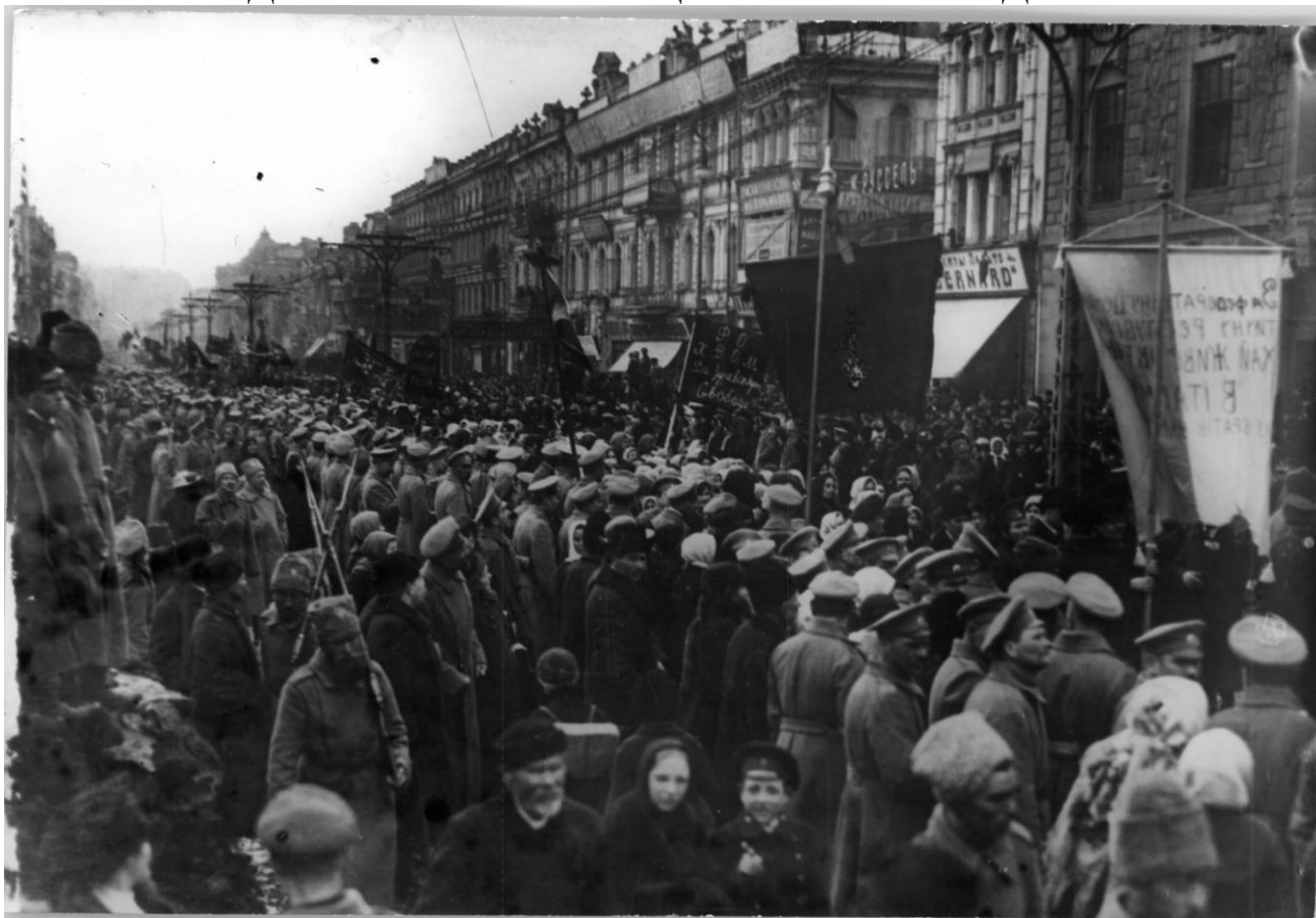
Демонстрація на вулиці Хрещатик у Києві. Березень 1917 року