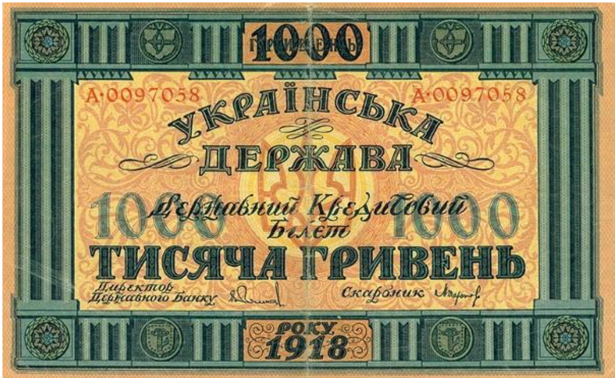
Купюра номіналом у 1000 гривень часів Гетьманату